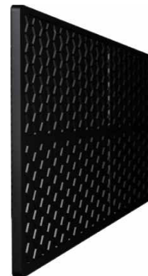
Active Carbon Filter

Der große Luftfilter entfernt die größeren Staubteilchen aus der Raumluft. Der Kohlenstofffilter (Active Carbon Filter) dagegen entfernt Zigarettenrauch, Ausdünstungen von Tieren und andere unangenehme Gerüche.